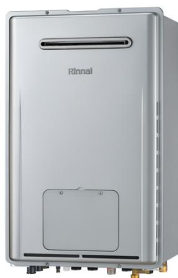
代表型式(給湯能力:24号、設置方式:屋外壁掛型)