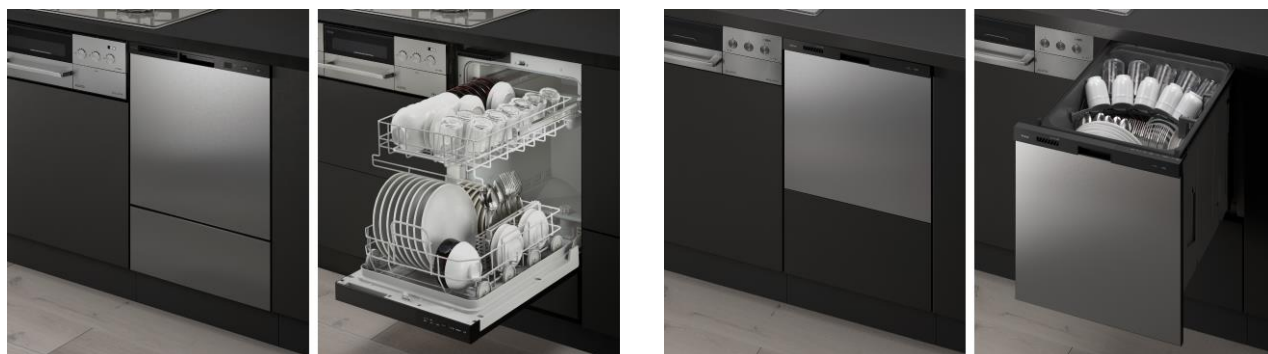
フロントオープンタイプ*6