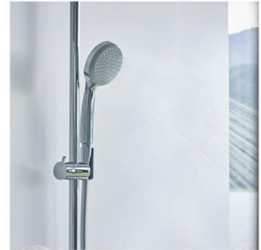
節水型シャワーヘッド