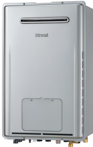
代表型式(給湯能力:24号、設置方式:屋外壁掛型)