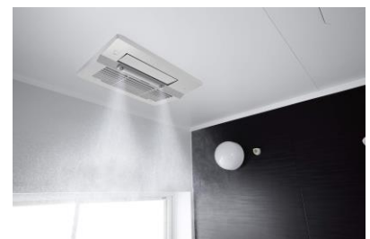
ミストサウナ使用イメージ (写真は RBHM-C339K1P)

低温で湿度が高く、お肌になじみやすいミストサウナ。乾いた熱気の中で汗をかきドライサウナと比べて身体への負担が少なく、気持ちよく汗をかくことができます。100 マイクロメートルほどの微細な水滴をしっかり浴びて爽快感を得られます。