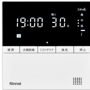
RBHM シリーズ用脱衣室リモコン