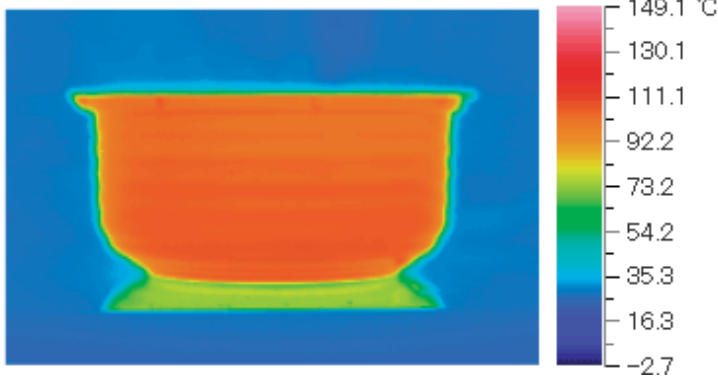
ガス炊飯器(RR-055MST)の炊飯時サーモグラフィ(当社調べ)

炊飯釜や加熱方式に様々な工夫を施した高価な電気炊飯器が人気を集めていますが、重厚な炊飯釜と複雑なお手入れ部品を必要とするものもみられます。強火力が自慢のガス炊飯器なら、軽いアルミ製炊飯釜と、取り扱いが簡単な数点の部品だけで、おいしく炊き上げることができます。