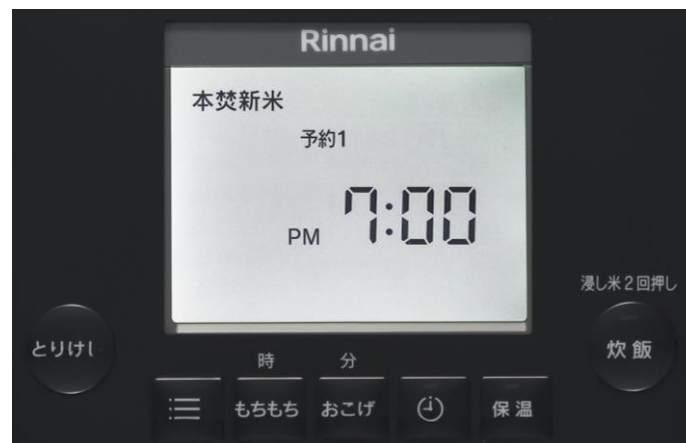
バックライト付き液晶画面と操作パネル