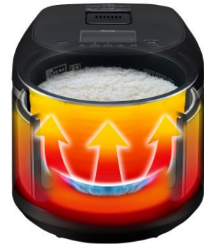
炊飯時のイメージ

直火による加熱に最適なアルミ製の炊飯釜。アルミは軽くて扱いやすい上に、ガスならではの強火力で炊飯釜全体を加熱することができます。