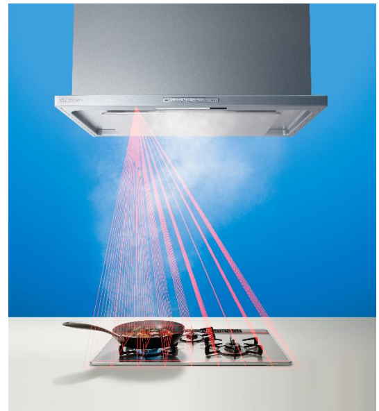
温度センサー照射イメージ (写真は OGR シリーズ)

レンジフードは調理によって風量を調整する必要がありますが、どれくらいの風量が適切なかがわからなかったり、調理状況によって変更することが面倒と感ずる場合もあります。「風量おまかせ運転」は、レンジフードに搭載した 8×8 の複眼タイプの温度センサーで、調理状況を検知することにより 3 段階の風量レベルを自動でコントロールする機能です。油煙が多く発生しやすい高温調理を検知したときは「強運転」で油煙をしっかり吸い込み、油煙が少ない低温調理を検知したときは「弱運転」で静かに油煙を吸い、快適な調理空間を実現します。また、効率よく油煙をキャッチし必要以上に風量を上げないので、消費電力の削減にも繋がります。なお、レンジフードエコ連動機能付ビルトインコンロ(デリシア、リッセ)の場合は、コンロからの情報を優先して風量を調整します。