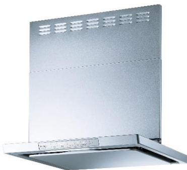
XGR-REC-AP604 SV(シルバーメタリック)