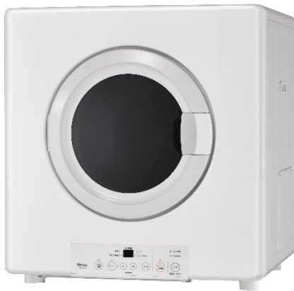
ガス衣類乾燥機 乾燥容量 8.0kg タイプ(業務用) RDT-80A 希望小売価格: 194,000 円(税抜価格) 発売日: 3月2日

ガス衣類乾燥機は、短時間で乾燥できる、花粉やPM2.5などが付着する心配がない、80℃以上のパワフルな温風で洗濯物の生乾き臭を抑制するといった特長を持っており、大量の洗濯物が発生する医療・介護施設や、ホテル、旅館、理・美容院など業務用途での需要も増えてきています。特に近年、介護人材の人手不足という課題からも、外干し不要で短時間で乾燥できるガス衣類乾燥機への期待が高まっています。