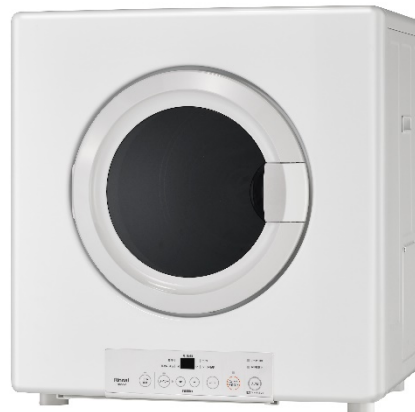
ガス衣類乾燥機 乾燥容量 5.0kg タイプ(業務用) RDT-54S 希望小売価格: 164,000 円(税抜価格) 発売日: 3月2日