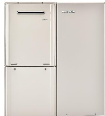
熱源機 RHBF-RK245AW タンクユニット RTUP-R506