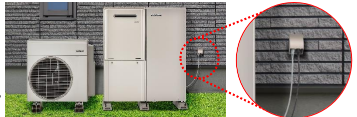
狭小地設置イメージ

◆ 屋外コンセント対応※2で専用電源工事が不要 ECO ONE Plug-in LOWBOY モデルは、ガス熱源機とヒートポンプを既設屋外コンセントへの電源接続※2で設置できます。別途、ブレーカーからヒートポンプ専用電源工事が不要で、給湯器買替時の施工が簡単になります。