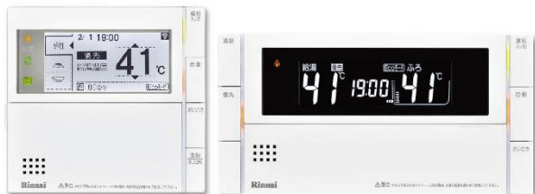
給湯暖房用熱源機・ふろ給湯器用 無線LAN対応リモコン MBC-302VC(A)

外出先からの帰宅途中にスマートフォンから「どこでもリンナイアプリ」で、浴槽へのお湯はりや床暖房の開始操作を行うことで、家に帰ってすぐの入浴や帰宅後すぐに暖まった部屋で過ごすことが可能になります。