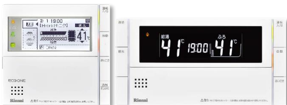
ECO ONE 用リモコン MBC-301VC(A)