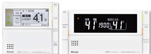
給湯暖房用熱源機・ふろ給湯器用リモコン MBC-302VC(A)