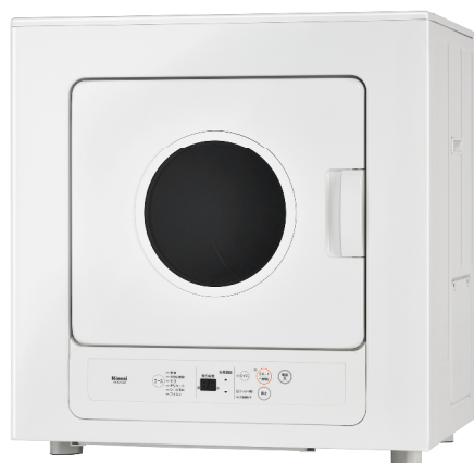
《業務用ガス衣類乾燥機》 型式:RDTC-53S 乾燥容量:5.0kgタイプ 希望小売価格:143,000円(税抜価格)