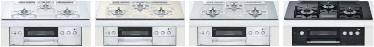
クリアホワイトミスト