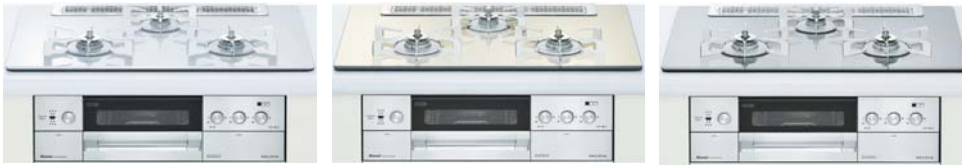
クリアホワイトミスト