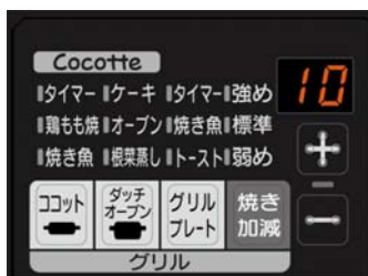
3V 乾電池タイプ グリル操作部