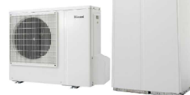
主要展示機器 ECO ONE (エコワン) 平成25年度省エネ大賞「経済産業大臣賞」受賞