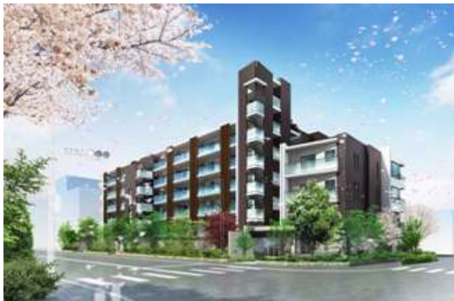
リストレジデンス用賀 (外観完成予定イメージ)