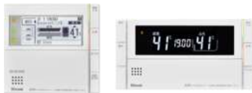
台所リモコン 浴室リモコン

リモコンセットMBC-301VC 小売価格:55,000円 発売日:2016年5月10日