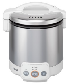
グレイッシュホワイト