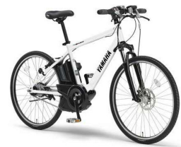
電動アシスト自転車

ECO ONE は、2011年4月に住宅の省エネルギー性能を定めた「住宅事業建築主の判断基準」でトップレベルの省エネ性能をもつ給湯器です。今年1月には平成25年度省エネ大賞の製品・ビジネスモデル部門において最高賞の「経済産業大臣賞」を受賞しました。省エネ大賞は、優れた省エネ活動や技術開発による先進型省エネ製品を表彰し、省エネルギー意識の浸透、省エネルギー製品の普及、促進に寄与することを目的としています。