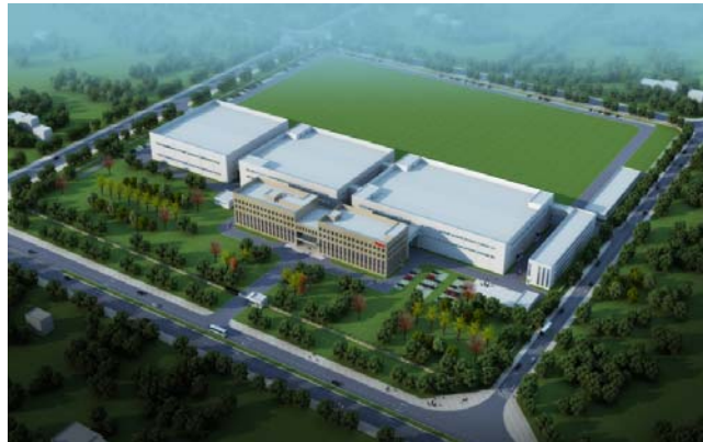
奉賢新工場 完成イメージ